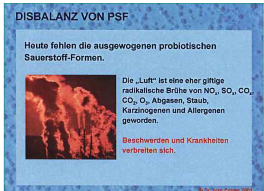
Abb. 1 Die verschmutzte Luft mit Ungleichgewicht der probiotischen Sauerstoffformen

Durch diesen schicksalhaften O 2 & Energiemangel können verschiedene vegetative Störungen, Beschwerden,